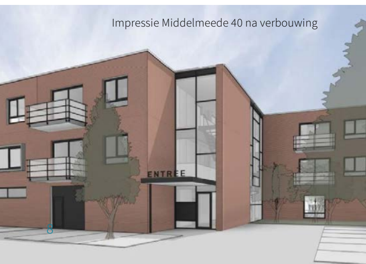
Impressie Middelmeede 40 na verbouwing

U kunt zich aanmelden via 50jaarhuurder@woonvizier.net of via een telefoontje naar (0162) 67 98 00.