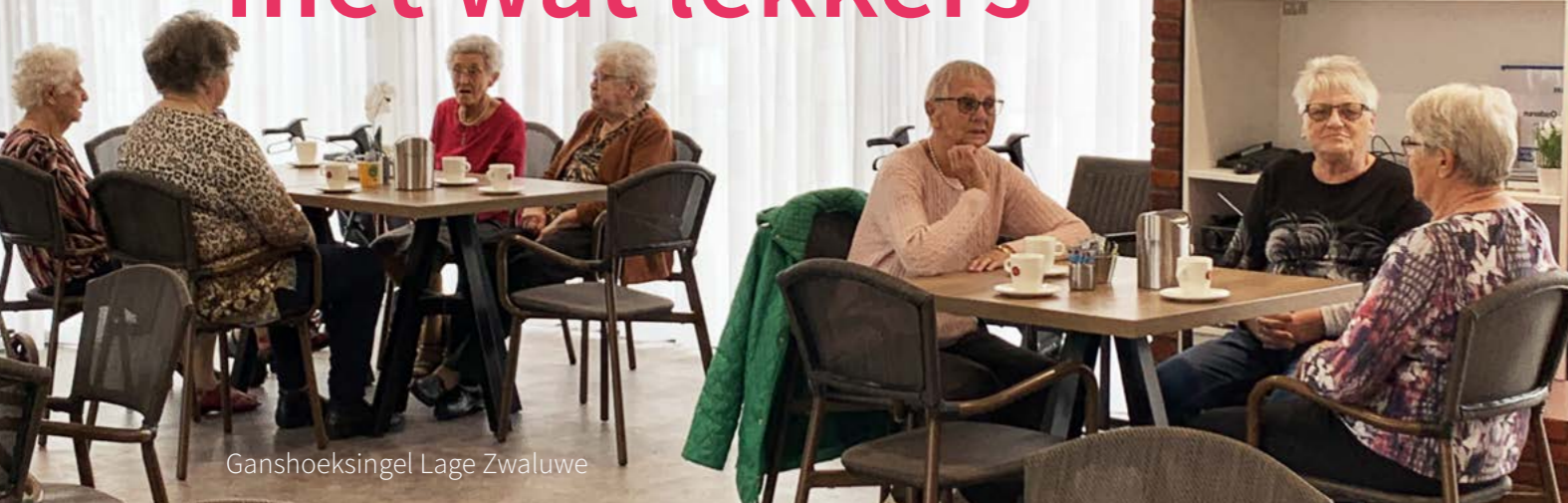
Ganshoeksingel Lage Zwaluwe

Iedereen wil het gevoel hebben van 'erbij horen' en 'ertoe doen'. Toch kunt u zich zo nu en dan misschien weleens alleen voelen. Zeker in de tijd waarin we nu leven.